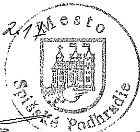
MVDr. Míchal Kapusta primátor mesta Spišské Podhradie