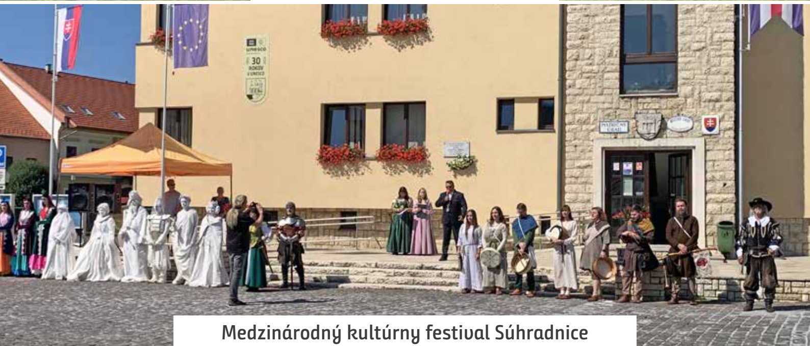
Medzinárodný kultúrny festival Súhradnice