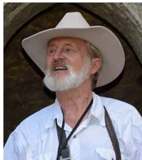
OSOBNOSTI NÁŠHO MESTA / ROZHOVOR