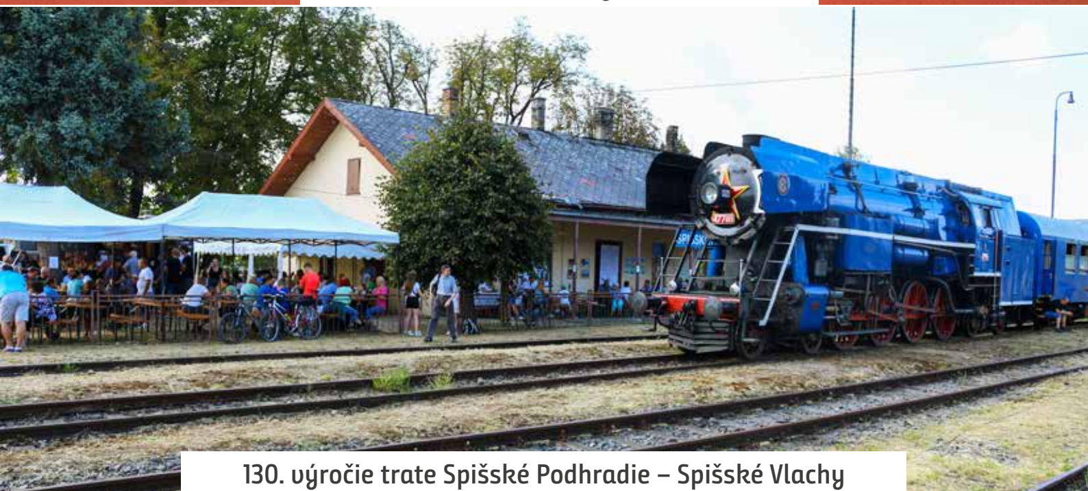
130. výročie trate Spišské Podhradie – Spišské Vlachy