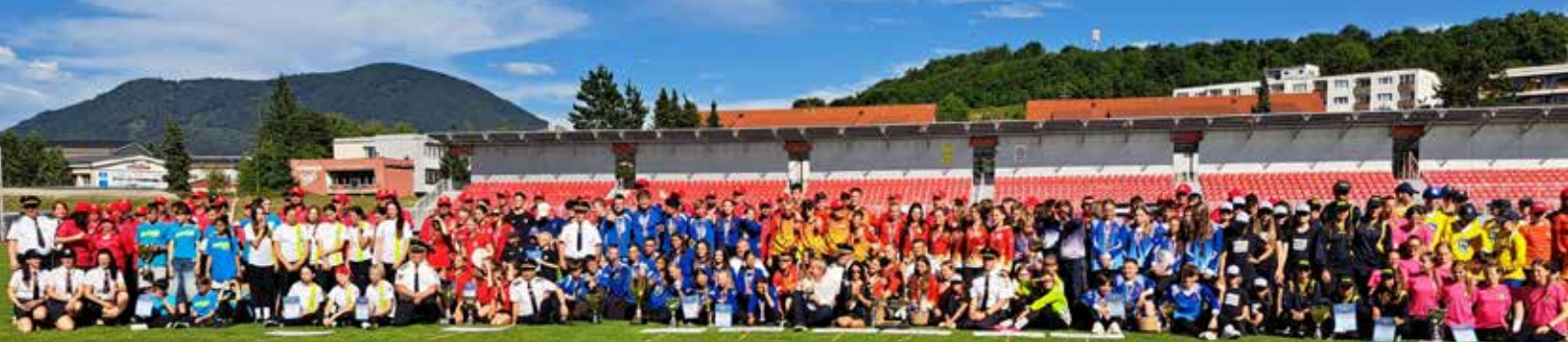
XV. Celoštátne kolo hry Plameň 2024