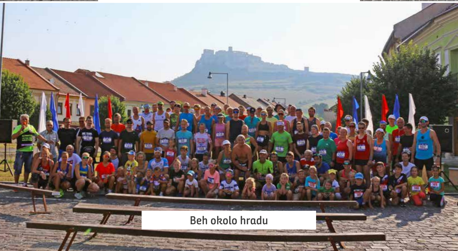
Beh okolo hradu