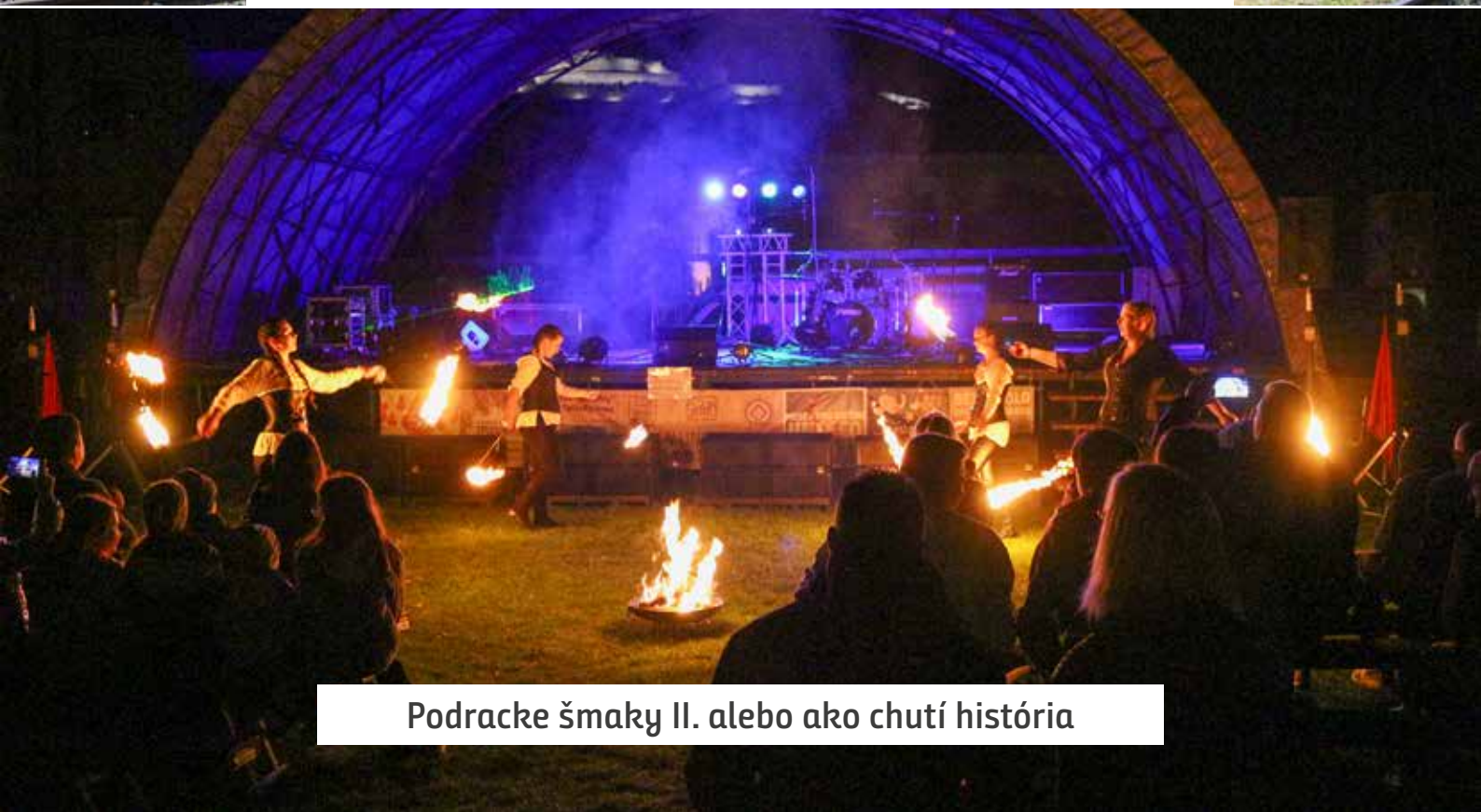
Podracke šmaky II. alebo ako chutí história