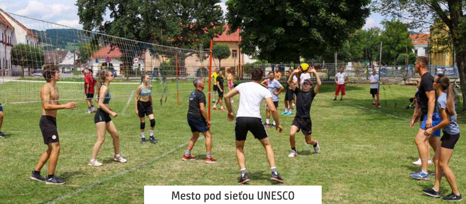
Mesto pod sieťou UNESCO